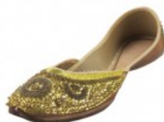
Handcrafted Beaded & Seq...